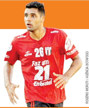
ROGÉRIO MICCOLI / AGENCIA BOTAFOGO