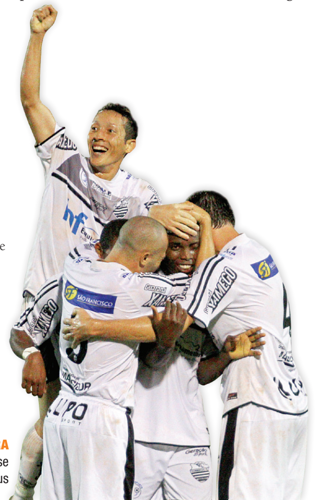
20 MAR 2013

UNIÃO ALVINEGRA Comercial tem tudo para se classificar diante do Juventus